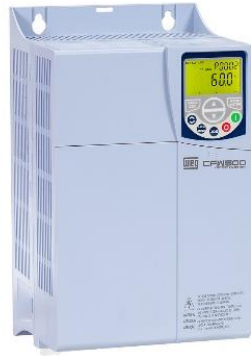
Figura 3 - imagem ilustrativa do inversor CFW500D47P0T2DB20.