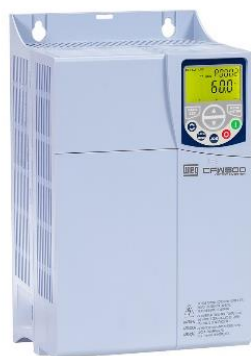
Figura 1 - imagem ilustrativa do inversor CFW500D47P0T2DB20.