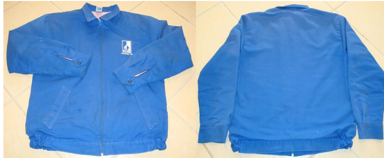
TABELA DE MEDIDA JAQUETA PRONTA