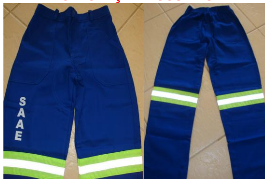
TABELA DE MEDIDA CALÇA OPERACIONAL SEMISSOCIAL MASCULINA PRONTA.